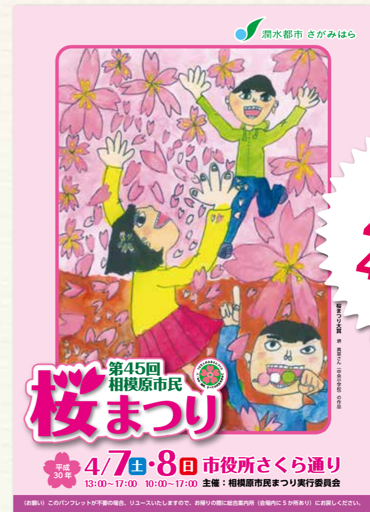
(第45回の桜まつりのパンフレット見本です)